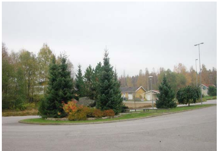
Vid busshållplatsen finns en liten "park" med soffor.

En cykelväg mellan den äldre delen av Brogetorp i väster och den nyare i öster ansluter vid vändslingan. Området sydväst om Illern 1 samt cykelvägen redovisas som naturmark.