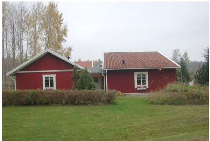
Den södra tillbyggnaden på Illern planeras att byggas mot busshållplatsen.

På Illern 1 avser man att placera den ena på västra sidan om befintlig byggnad och den andra på södra sidan mot bussvändslingan. För att kunna uppföra den södra tillbyggnaden behöver mark från kommunens fastighet Brogetorp 3:15 ianspråkta. Området är ca 370 m 2 och har bestämmelsen "Natur" i gällande plan. I förslaget blir detta område kvartersmark för bostäder.