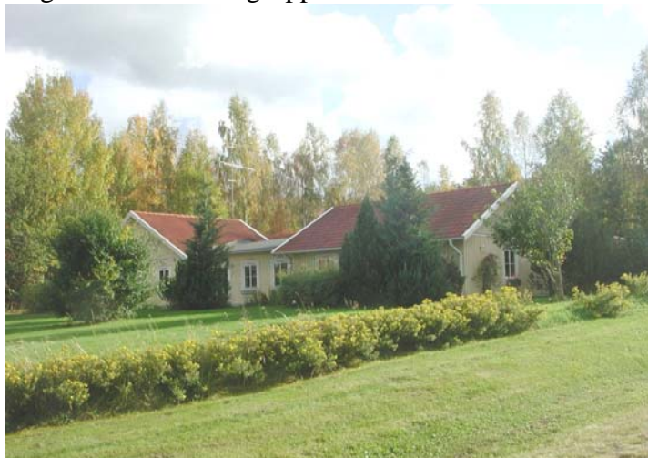
Gruppbestaden på fastigheten Rådjuret 1

Gruppbestäderna är belägna på fastigheten Illern 1 på Bo Hammarskjölds väg och fastigheten Rådjuret 1 på Novembervägen. Båda fastigheterna ägs av Gruppbestäder i Sverige AB och hyrs av Flens kommun.